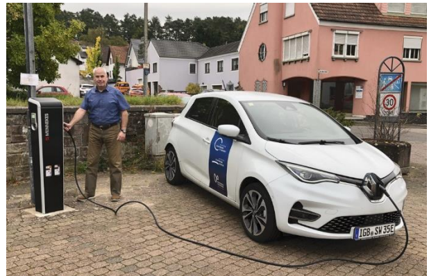
Noch fehlt die Beschilderung, aber die neue Ladesäule am Marktplatz ist in Betrieb.

65 kWh Akkukapazität entspricht einer realistischen Reichweite von ca. 350 – 450 km. Ein guter Mittelwert, der zwischen Kleinwagen (ca. 35 kWh Akkukapazität) und Oberklassenlimousine (ca. 85 – 95 kWh) liegt.