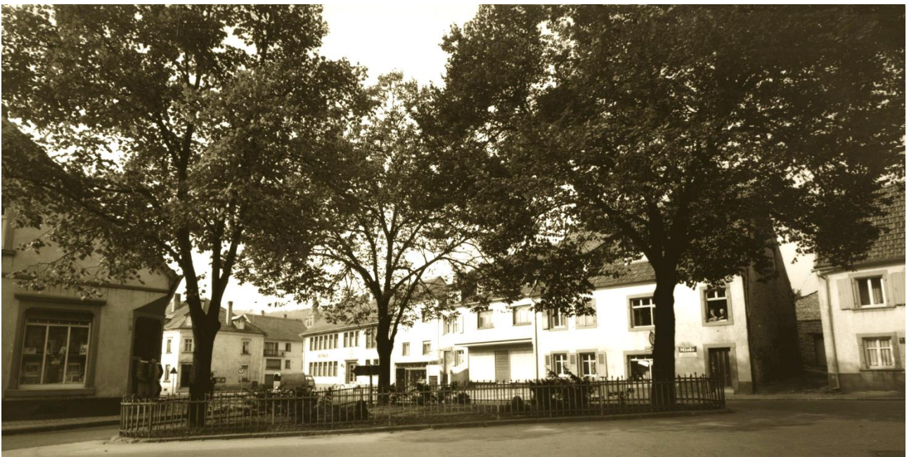
Die Dreilinden in der Dorfmitte vor der Baumfällung 1962