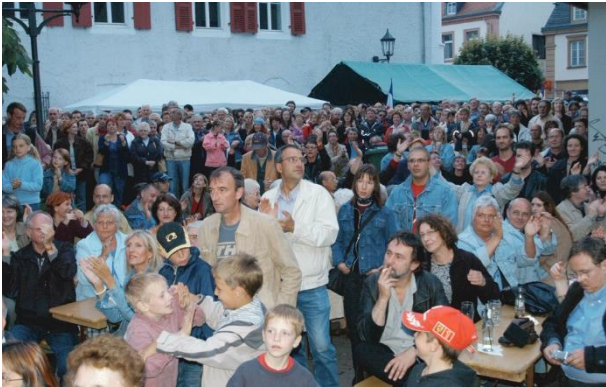
Vor der Bühne am Bierbrunnen gab es 2004 keinen Platz mehr beim Auftritt von Joy Fleming.

ST. INGBERT, 20.12.2019 . Joy Fleming war 2004 Gast beim Ingobertusfest in St. Ingbert und begeisterte das Publikum von Beginn an mit ihrer Stimmgewalt. Auch nach ihrem Tod Ende September 2017 bleibt sie unvergessen – und das nicht nur bei ihren Fans. Die Mannheimer Künstlerin überzeugte sowohl mit ihrer Persönlichkeit als auch mit ihrer schwarzen Soulstimme. Ihr Name war und ist Programm.