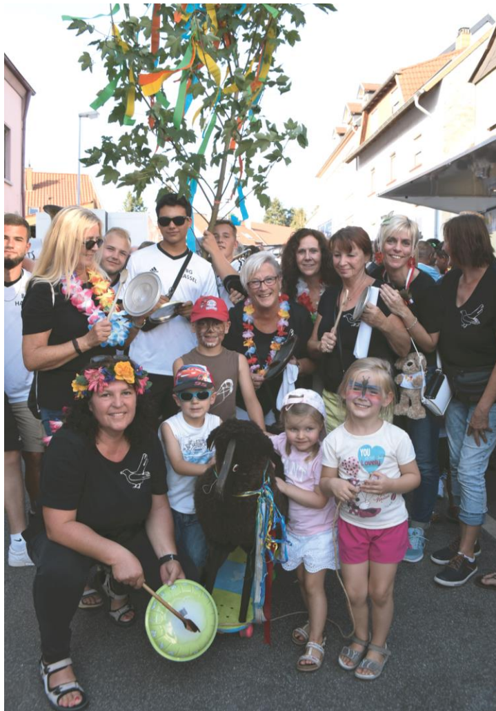
Auch in diesem Jahr wird zum Abschluss des Dorffestes der Hammel ausgetanzt.

HASSEL, 16.-18.08.2019 . Am kommenden Wochenende feiert Hassel zum 39. Mal sein Dorffest. Der Ortsrat und die Arbeitsgemeinschaft Hasseler Vereine laden von Freitag bis Sonntag für drei Tage ein. Dann heißt es ab 18 Uhr, nachdem Ortsvorsteher Markus Hauck an der Hauptbühne am Marktplatz mit dem Fassanstich eröffnet hat, Party pur in der Dorfmitte von Hassel. Die Anzahl der Standbetreiber liegt wie im Vorjahr bei 16. Großen Wert legt man in Hassel darauf, dass Hasseler Vereine und Organisationen das Dorffest mit ihrem reichhaltigen Angebot bereichern. Professionelle Anbieter werden hier nicht berücksichtigt. Das Essensangebot ist breit gefächert und reicht von der einfachen Rostwurst und Pommes über Wiesentalsandwich, Kuckuckssteak, Crêpe, Owegebäckelte bis hin zu „Spitzbuwe“ aus der alten Backstubb.