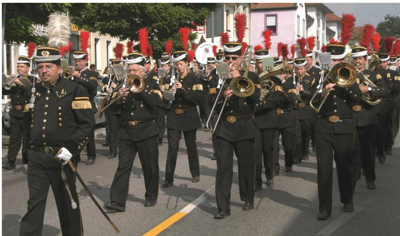
Die Bergkapelle zog bereits 2009 mit einem Festumzug durch die Straßen von St. Ingbert

Befreundete Vereine gestalten den weiteren Nachmittag mit viel Musik, so werden u. a. der Musikverein Hochscheid-Reichenbrunn, der Musikverein Rohrbach und der Musikverein Lyra Eschringen zu hören sein. Zum Ausklang des Festtages wird ab ca. 18 Uhr das Geburtstagskind selbst, die Bergkapelle St. Ingbert, für fröhliche Stimmung sorgen.