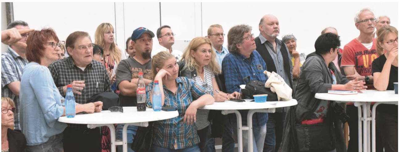
Großes Bürgerinteresse herrschte im Kuppelsaal an den Bekanntgaben der Wahlergebnissen.

Verfügung. Denjenigen Bürgern, die bereits bei der Hauptwahl am 26. Mai 2019 an der Briefwahl teilgenommen haben, werden die Briefwahlunterlagen automatisch zugeschickt und müssen nicht noch einmal extra beantragt werden.