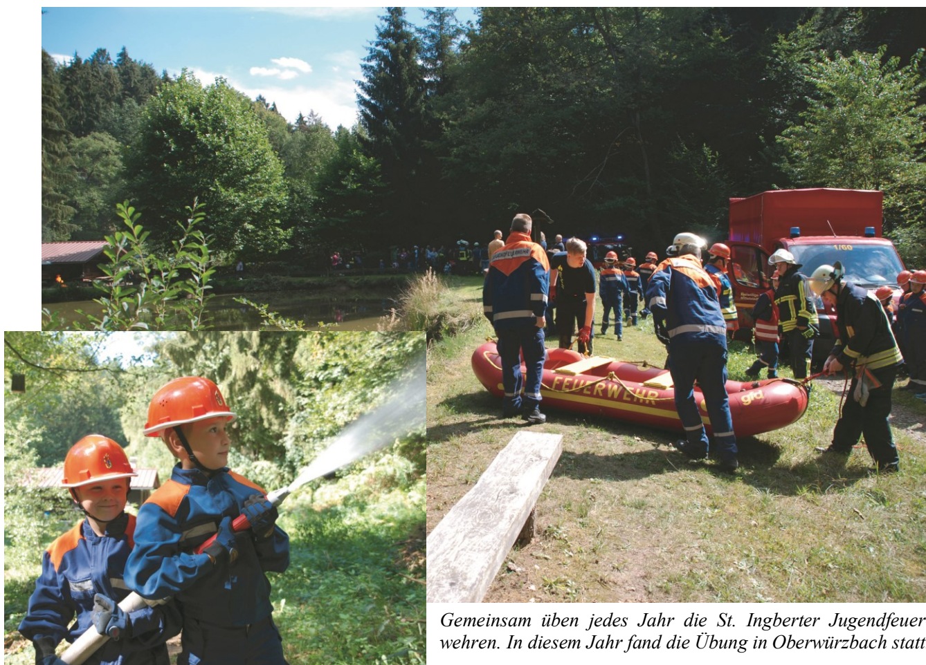
Gemeinsam üben jedes Jahr die St. Ingberter Jugendfeuerwehren. In diesem Jahr fand die Übung in Oberwürzbach statt.

OBERWÜRZBACH, 08.09.2018. An einem Samstag im September trafen sich die Jugendfeuerwehren der Stadt St. Ingbert zur alljährlichen Jahreshauptübung. In jedem Jahr findet die Übung in einem anderen Ortsteil in St. Ingbert statt. Für die angehenden Feuerwehrleute ist diese Übung der Höhepunkt des Jahres. Ausrücken mussten die zukünftigen Einsatzkräfte dieses Mal nach Oberwürzbach ins Laichweiher-Tal.