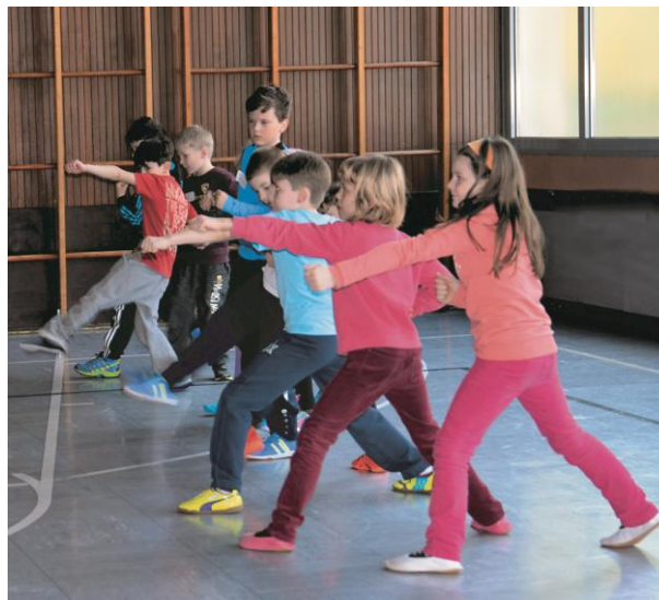
Neuer Kurs für Grundschüler unter neuer Leitung

Schülerinnen und Schüler der Grundschulen lernen, sich richtig zu verhalten, auch wenn sie alleine sind, sowohl gegenüber einem Fremdtäter als auch gegenüber dem nahen Umfeld, sie lernen den richtigen Umgang, wenn es zu Konflikten untereinander auf dem Schulhof und auf der Straße kommt (Mobbing, Ausgrenzen, Streiten, Erpressung usw.). Dabei entdecken sie ihre Stärken und Fähigkeiten, die sie oft vorher nicht kannten. - cst