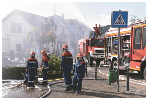
Unter den Augen einer großen Anzahl von interessierten Bürgern lief die Übung ab.

Nach 8 Minuten sollen die Rettungskräfte bei einem Ernstfall vor Ort sein. Dies wurde bei der Übung der rund 100 Einsatzkräfte natürlich deutlich unterschritten. Den richtigen Umgang mit immer größer werden technischen Anforderungen war eines der Hauptziele der Übung. Hier kamen auch Übungs-atemmasken zum Einsatz. Keine Chemie wurde – wie bei einem richtigen Einsatz mit diesem Unfallpotenzial – verwendet, sondern nur ganz normaler Schaum wie man ihn auch aus dem Privathaushalt her kennt.