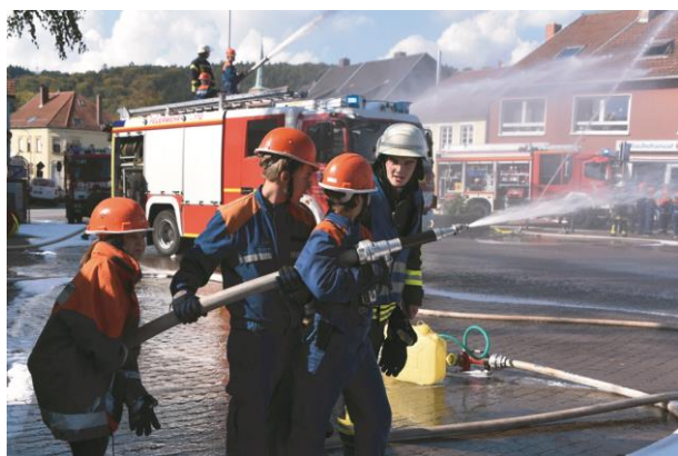
„Wasser marsch“, hieß es am Samstagnachmittag.